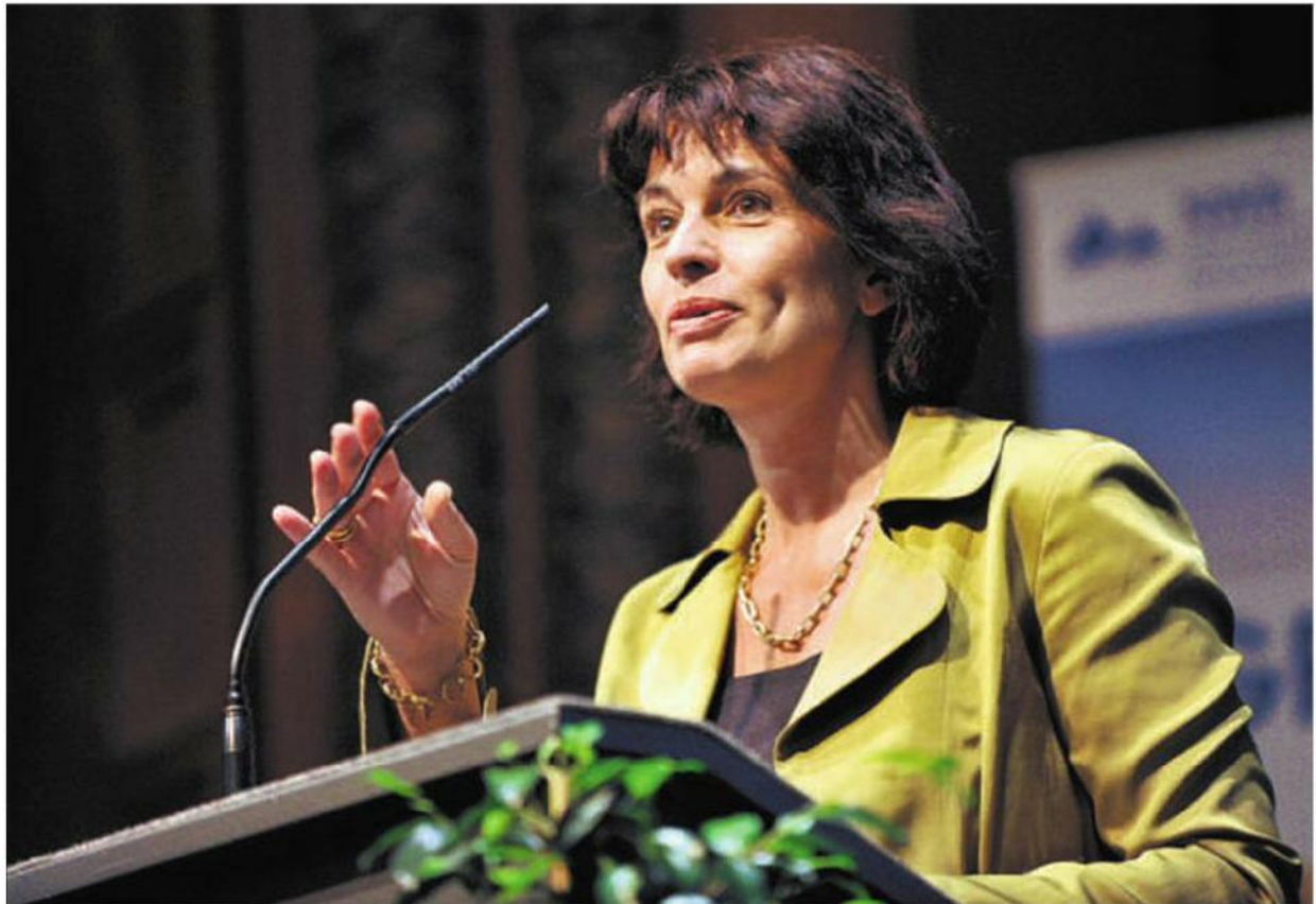
Bundesrätin Doris Leuthard spricht an der Tagung des Netzwerks Wasser im Berggebiet in Altdorf.