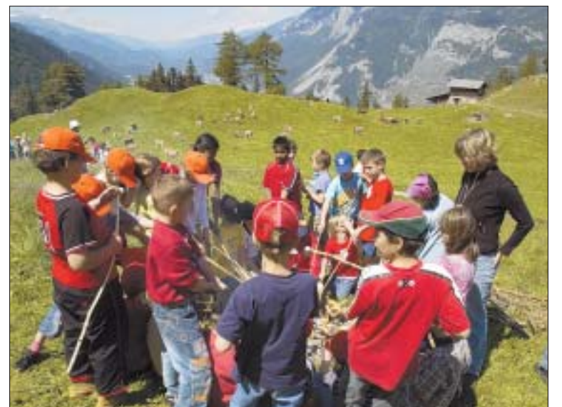
Gestern ist der «schönste Schultag des Jahres» für die Churer Schüler zu Stande gekommen: die Maiensässfahrt. (tam)